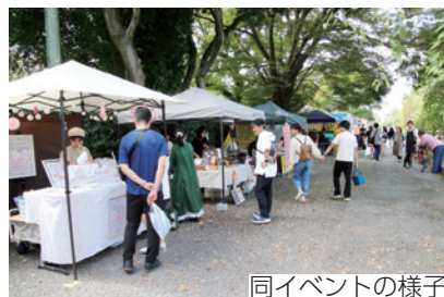
同イベントの様子